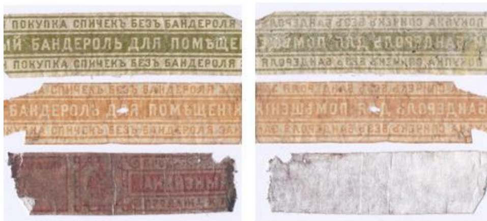
Рис. 4. Бандероли подлинные (салатовый бандероль с коробка фабрики Лапина 1910 года, оранжевый бандероль с коробка фабрики Казурова выпуска до 1905 года) и поддельный (красный внизу). В левой части вид с лицевой стороны, в правой части те же бандероли с обратной стороны. Видно, что подлинные бандероли напечатаны на полупрозрачной бумаге, а поддельный на белой.

После отделения бандероля, наклеенного поперёк коробка, я обнаружил, что коробок подвергся серьёзной реставрации - картонная верхняя крышка в его правой части (19,5 мм) была подклеена изнутри к основной части коробка. Место склейки снаружи было закрыто этой частью бандероля ( Рис. 3 ). В отличие от ранее отделённых мною бандеролей царских коробков, этот отделялся от коробка с трудом.