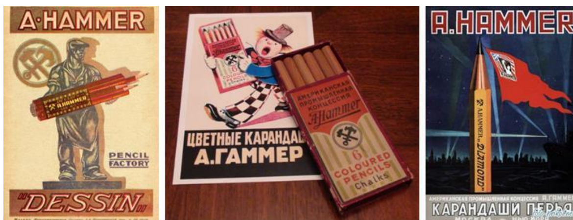
Рис. 8. Рекламные плакаты концессии Арманда Хаммера.

В Интернете можно найти несколько плакатов, которые призваны рекламировать это концессионное предприятие Арманда Хаммера (Рис. 8). Обратите внимание на логотип этой компании – переkreщенные якорь и молот.