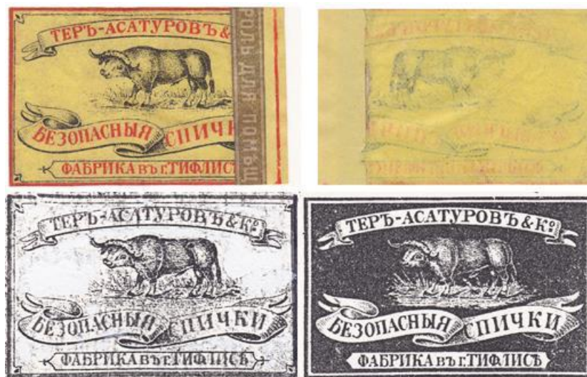
Рис. 6. Этикет от коробка фабрики Тер-Асатурова. Верхний ряд: лицевая и оборотная стороны этикета из коллекции Р.Э. Узбекова, повреждения на котором были замаскированы (не мною!) полоской, вырезанной из средней части бандероля. Нижний ряд: чёрно-белые фотокопии этикетов фабрики Тер-Асатурова из каталога П. Дёрлинга [8].

Что, впрочем, тоже сразу выдавало подделку, поскольку бандероль наклевался вдоль коробка, чтобы предотвратить открывание внутреннего ящичка коробка, не говоря уже о том, что полоска, вырезанная из средней части бандероля не могла быть наклеена на коробок.