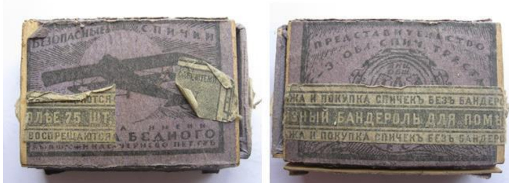
Рис. 2. Царский бандероль на коробке спичечной фабрики имени Демьяна Бедного. Из коллекции Р.Э. Узбекова.

Мог ли быть в принципе наклеен царский бандероль на советский коробок? В одной из своих предыдущих статей я уже писал о царском бандероле на советском коробке ( Рис. 2 ), так что этот случай не является чем-то уникальным [2]. После этого я видел ещё пару советских коробков с царскими бандеролями, но всякий раз это были, как и в первом случае, бандероли чёрного цвета, которые сменили салатовые бандероли в 1914 году. Использование таких бандеролей после 1917 года можно понять, но чтобы на советский коробок был наклеен бандероль оранжевого или красного цвета !?