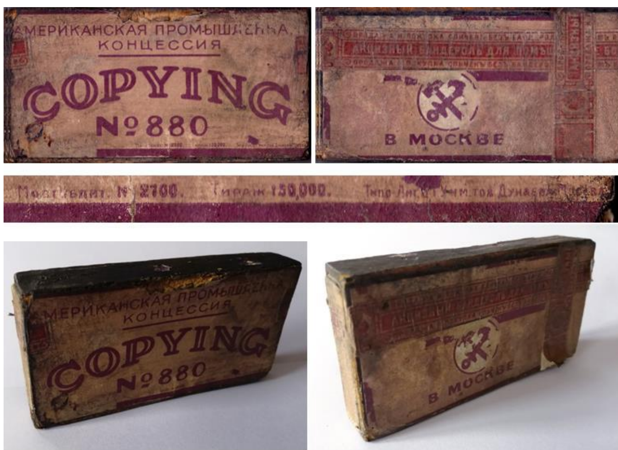
Рис. 1. Сканированные изображения коробка Американской промышленной концессии и внешний вид этого коробка. Также показано увеличенное изображение сигнатуры. Из коллекции Р.Э. Узбекикова.

Настоящая статья посвящена исторической филлумении, поэтому в начале исследования необходимо убедиться, что объект исследования действительно имеет отношение к спичкам. Так что предваряю я своё «расследование» по возможности подробным описанием коробки.