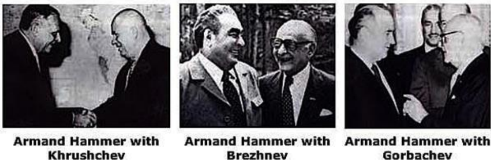
Рис. 7. Арманд Хаммер на встречах с руководителями СССР Н.С. Хрущевым, Л.И. Брежневым и М.С. Горбачёвым. Фотографий с В.И. Лениным и Л.Д. Троцким отыскать не удалось.

Ленин говорил Хаммеру: "Взгляните, - вот чего достиг ваш народ, вот что значит прогресс - строительство, изобретения, машины, механизация, облегчающая человеческий труд. Россия сейчас похожа на вашу страну во времена первооткрывателей. Мы нуждаемся в знаниях и энтузиазме, которые сделали Америку такой, какая она сегодня" [9, стр. 73].