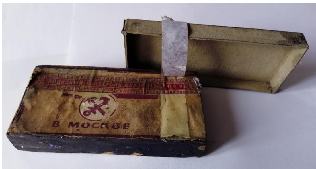
Рис. 3. Коробок после отделения первого бандероля. Видно, что бумага в правой части не является продолжением основной части коробка. В частности, на ней нет даже следов продолжения рисунка (вертикальных красных полос).

Важная информация может заключаться и в размере тиража этикетки. Для книг тираж в 150 000 достаточно большой, но для спичечных этикеток - это очень незначительная цифра. Например фабрика Лапшина в деревне Новая в 1910 году произвела 220 000 ящичков спичек, следовательно в день было сделано округлённо 603 ящичка или 603 000 коробков. Мы видим, что 150 000 коробков - это продукция даже не одного дня для крупной спичечной фабрики. Следовательно, мы точно имеем дело не с рядовым коробком, а со спичечными коробками, выпущенными с рекламной целью. Кого же рекламировали эти коробки, какую американскую концессию?