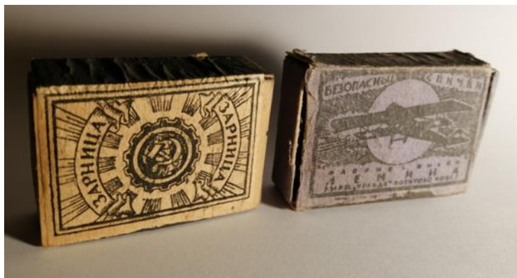
Рис. 9. Коробки 1920-годов. Из коллекции Р.Э. Узбекова.

И мои предчувствия меня, к сожалению, не обманули. Я довольно быстро обнаружил, что фирма «COPYING» выпускала как раз перья для ручек. А зачем же намазка на ребрах коробка? Я ещё раз внимательно изучил эту намазку. Она была довольно гладкой, а не шершавой, какая должна быть у спичечного коробка.