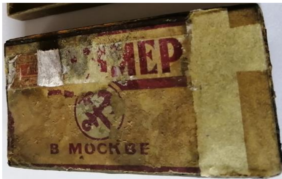
Рис. 5. Коробок после частичного отделения второго (продольного) бандероля.

Показалась буква «Р», потом «Е», радости моей не было предела... Потом я увидел «М», а далее моя радость сменилась разочарованием, буквы под левой частью бандероля были сильно стёрты. Но второе «М» всё же ещё читалось. Получалось «... .. ММЕР» ( Рис. 5 ).