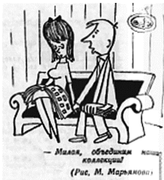
Рис. 4. Юмористические иллюстрации из 3 выпуска «Советского коллекционера» за 1965 год.

В статье использованы фотокопии выпусков журнала «Советский коллекционер», размещённые на сайте http://sovmint.ru/library/zhurnaly/zhurnal-sovetskij-kollekcioner-1963-1992/ .