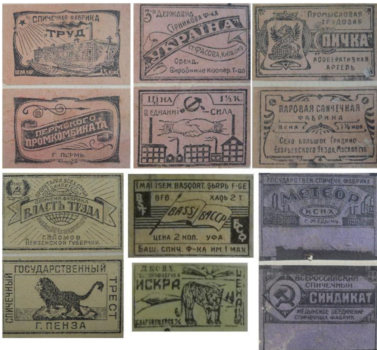
Рис. 4. Несколько этикеток из «советской» части «Общественной коллекции», представлены этикетки 1920-30-ых годов.