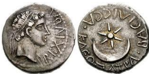
Рис. 3. Шестилучевая звезда с полумесяцем на старинной монете.

В верхней части этикета изображён герб, представляющий собой комбинацию полумесяца и шестиконечной звезды. Этот двойной символ известен ещё с античных времен. Я нашёл в Интернете ( 3 ) такое объяснение этого знака: «... полумесяц - символ процветания, звезда - символ цели. В сборе получается "благоприятное развитие под благодатным управлением"».