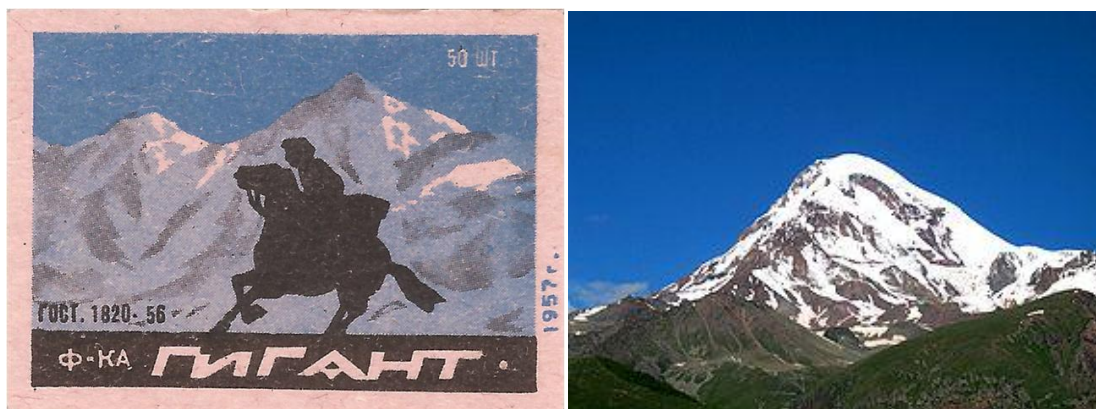
Рис. 4. Изображение горы Казбек на этикетке фабрики «Гигант» 1957 года. Этот рисунок художника Роберта Грабе знаком курильщикам по пачке советских папирос «Казбек». Только на «спичечном варианте» у всадника исчезла борода. Этикетка из коллекции автора статьи. Рядом фотография горы Казбек с сайта (4).

Обратим теперь своё внимание на всадников, которые сошлись в сабельном поединке. Обращенный к нам лицом казак в левой руке держит знамя, а находящийся к нам спиной турок или горец атакует его. Лошади идут параллельно, значит атакующий догоняет казака. За спиной у казака ружьё, но он не успел им воспользоваться и выхватил шашку. Ему пришлось бросить поводья, чтобы отбить первую атаку. Автор рисунка подчёркивает свою симпатию к казаку, изображая его на белом коне, а его противника на тёмно-гнедом. Казак безбородый. Возможно именно на Кавказе казаки брили бороды, чтобы в бою было легче отличать своих от противников, поскольку, мы видим, что одежда у обоих участников поединка в целом похожа.